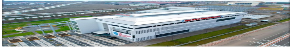
Resim 1. Yeni yerleşkemizden bir görüntü